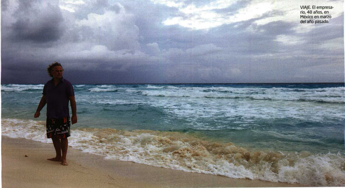
VIAJE. El empresario, 48 años, en México en marzo del año pasado.